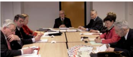
Conseil d'administration, rue Amélie