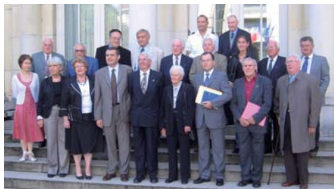
▲ Installation du nouveau Président du Comité de l'Ain par le Préfet du département

Le Bureau National assure la gestion régulière de la Fondation. De septembre à juillet, il se réunit chaque jeudi. Tous ses membres sont en contact permanent le reste de la semaine.